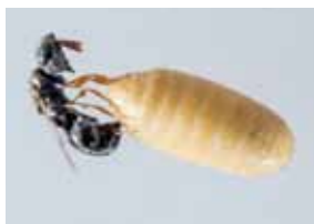
格氏突闊小蜂寄生東方果實蠅的蛹