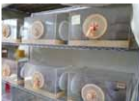
蛹寄生蜂室內大量繁殖