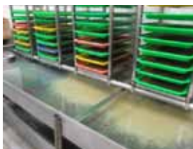
東方果實蠅幼蟲收集器