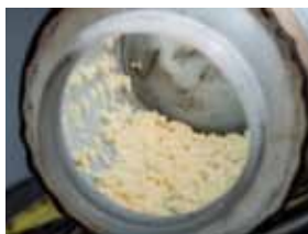
東方果實蠅卵收集器