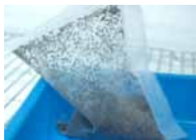
利用網袋於田間釋放蛹寄生蜂