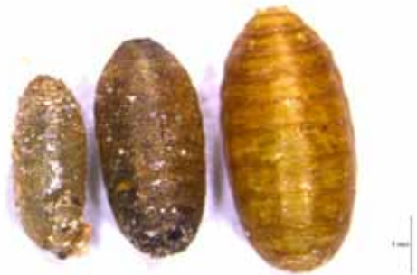
圖二、蛹大小可分辨東方果實蠅蛹是否有被卵寄生蜂寄生。卵寄生蜂雄蟲(左)、雌蟲(中)、東方果實蠅(右)