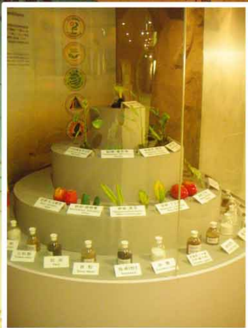
用藥輔導 for pesticides