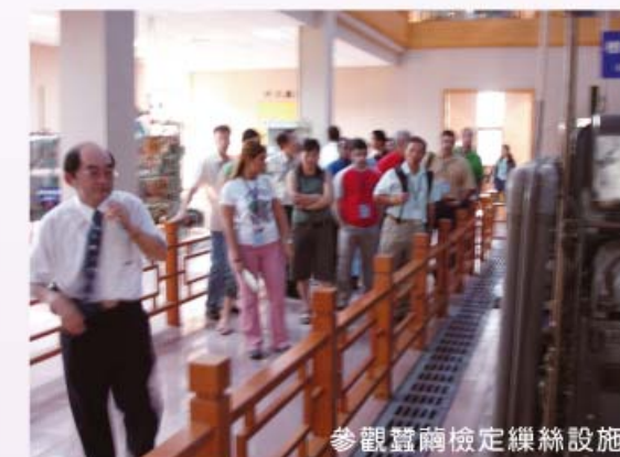
參觀蠶繭檢定繅絲設施