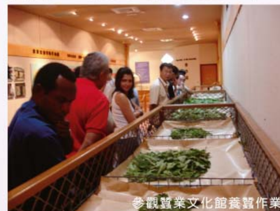
參觀蠶業文化館養蠶作業

多明尼加、海地、阿根廷、宏都拉斯、巴拿馬、馬拉威、新幾內亞、泰國及越南等10國服務於政府紡織界專家們，透過紡織產業綜合研究所安排，特於9月27日參觀本場台灣蠶業文化館，對蠶業相關資訊詢問甚詳。