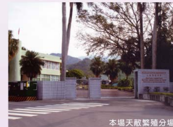
本場天敵繁殖分場