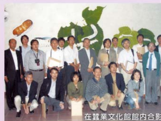
在蠶業文化館館內合影

日本國獨立行政法人果樹研究所及鳥取縣等5所園藝試驗場研究人員一行18人，透過亞東關係協會及農委會國際處安排，於11月9日蒞場參訪，此行主要目的，瞭解我國葡萄等果品輸日檢疫事宜，並前往卓蘭地區農家果園與本場研究人員，在現場交換果樹栽培技術心得。