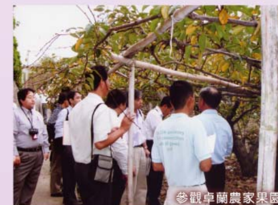
參觀卓蘭農家果園