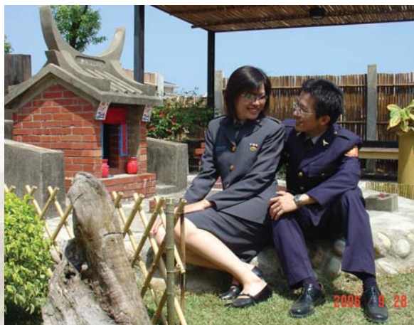
軍警聯姻~土地公來保佑