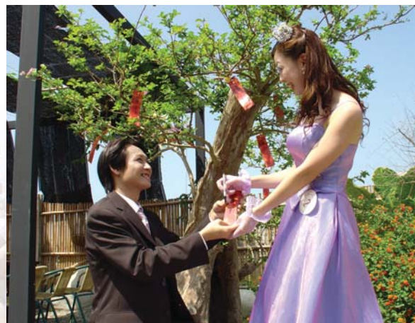
請你保證愛我一萬年