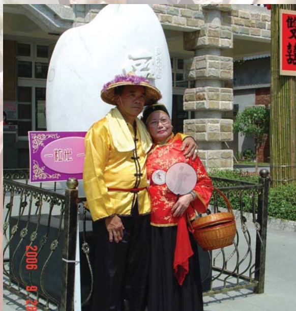
抱著妳的感覺真好