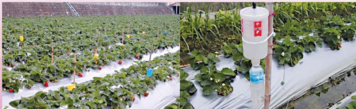
有色粘板捕捉害蟲

註：另有關「有機農產品生產規範—作物」，因限於篇幅，不再轉載，請自行參考行政院農業委員會農糧署網站 ( http://www.afa.gov.tw/laws_index.asp > 法規及公告 > 行政規則 > 農業資材類 > 有機農產品生產規範—作物)，將有詳細之介紹。