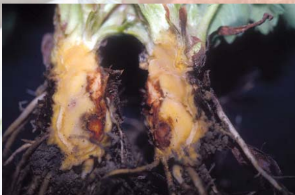
炭疽病在冠部之病徵