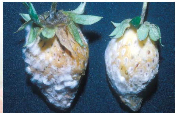
疫病罹病果實上佈滿菌絲