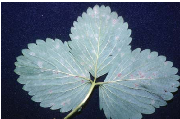
白粉病在葉片上之病斑