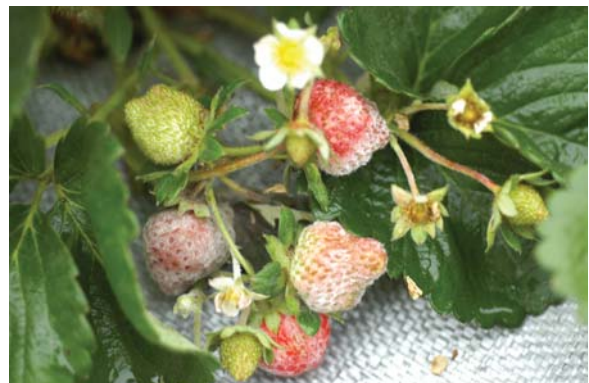
白粉病在果實上之病斑