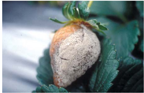
灰黴病果實上佈滿分生孢子