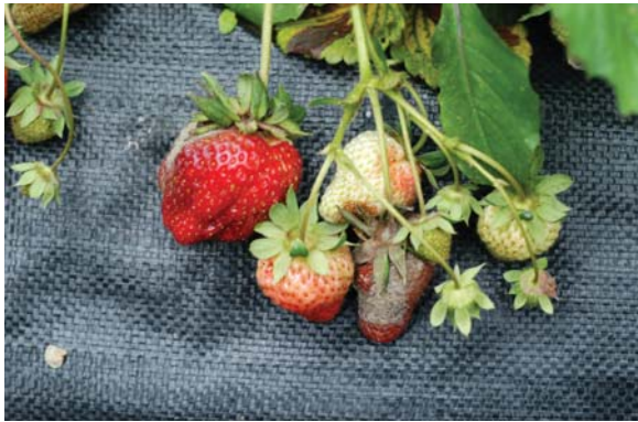
葉片及果實發育期感染灰黴病