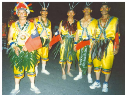
熱心參與社區事務