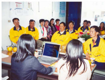
辦理班員電腦資訊相關訓練

該班班員間互動佳且向心力極強，自班成立16年以來，班員皆相當熱心參與社區公益工作，多年來盡心盡力付出許多。該班曾發動班員向里民勸募社區活動中心興建用地經費，推動卓蘭鎮及上新里之社區發展。平時主動協助清理里內水溝、整理週遭環境、割除雜草，並積極參與地方民俗文化活動，協助地方困苦家庭度過難關，深受地方好評。