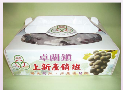
辦理虎尾糖廠觀摩活動