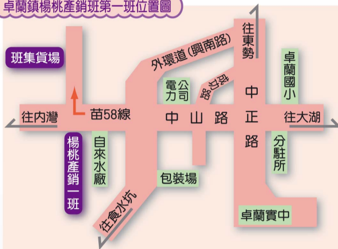
卓蘭鎮楊桃產銷班第一班位置圖