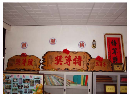
參加相關評鑑比賽勇奪多項大獎