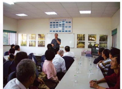
辦理虎尾糖廠觀摩活動