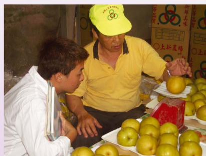
注重產品品質管理作業