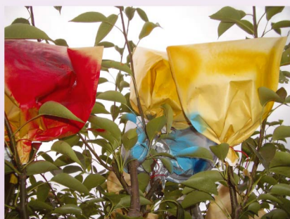
善用顏色管理以分辨梨穗嫁接順序