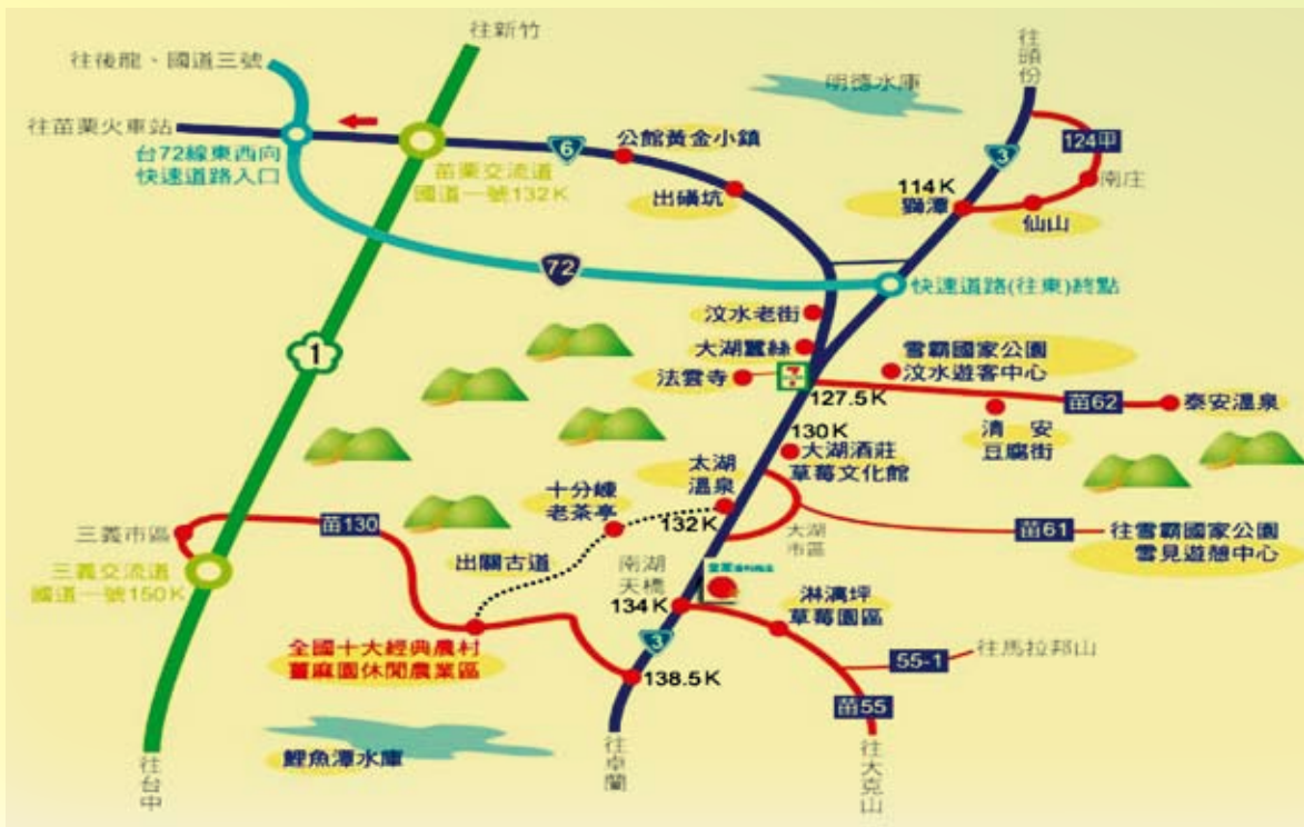
大湖薑麻園休閒農業區旅遊導覽路線圖