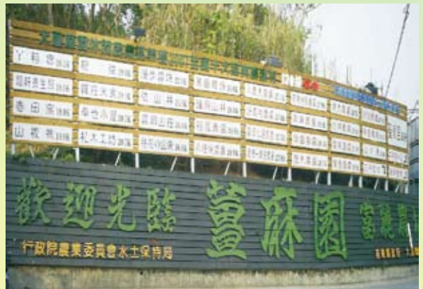
薑麻園休閒農業區入口告示牌