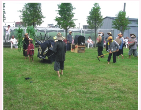
▲ 阿公阿嬤組成的「千歲歌舞團」相聚時練習歌舞自娛，真是好不快樂。