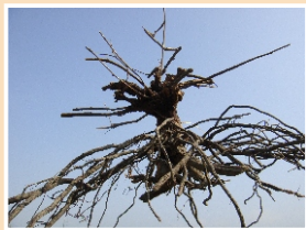
▲細本山葡萄根部形態