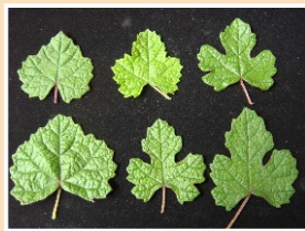
▲細本山葡萄葉形多變化