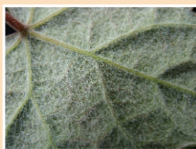
▲細本山葡萄葉背佈滿白色 茸毛