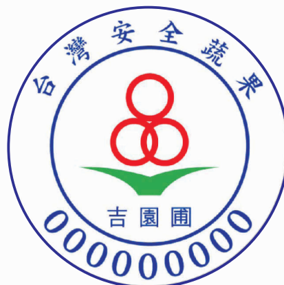
圖1. 吉園圃安全蔬果標章

吉園圃於97年度再度恢復續約(新標章如圖1)，重點在於輔導農民安全用藥，基本精神為農藥的合理使用，針對作物病蟲害施以適量之推薦藥劑。加入吉園圃之班員必須確實填寫用藥紀錄，並且提供輔導人員審核查閱，以符合安全用藥。申請吉園圃標章之審查流程如圖2所示，關於所需檢附之申請文件包含：最近三個月以上之病蟲草害防治紀錄及最近六個月內農藥殘留檢驗合格文件。而已經通過產銷履歷驗證之農民得以產銷履歷驗證證書影本代替上述之文件。