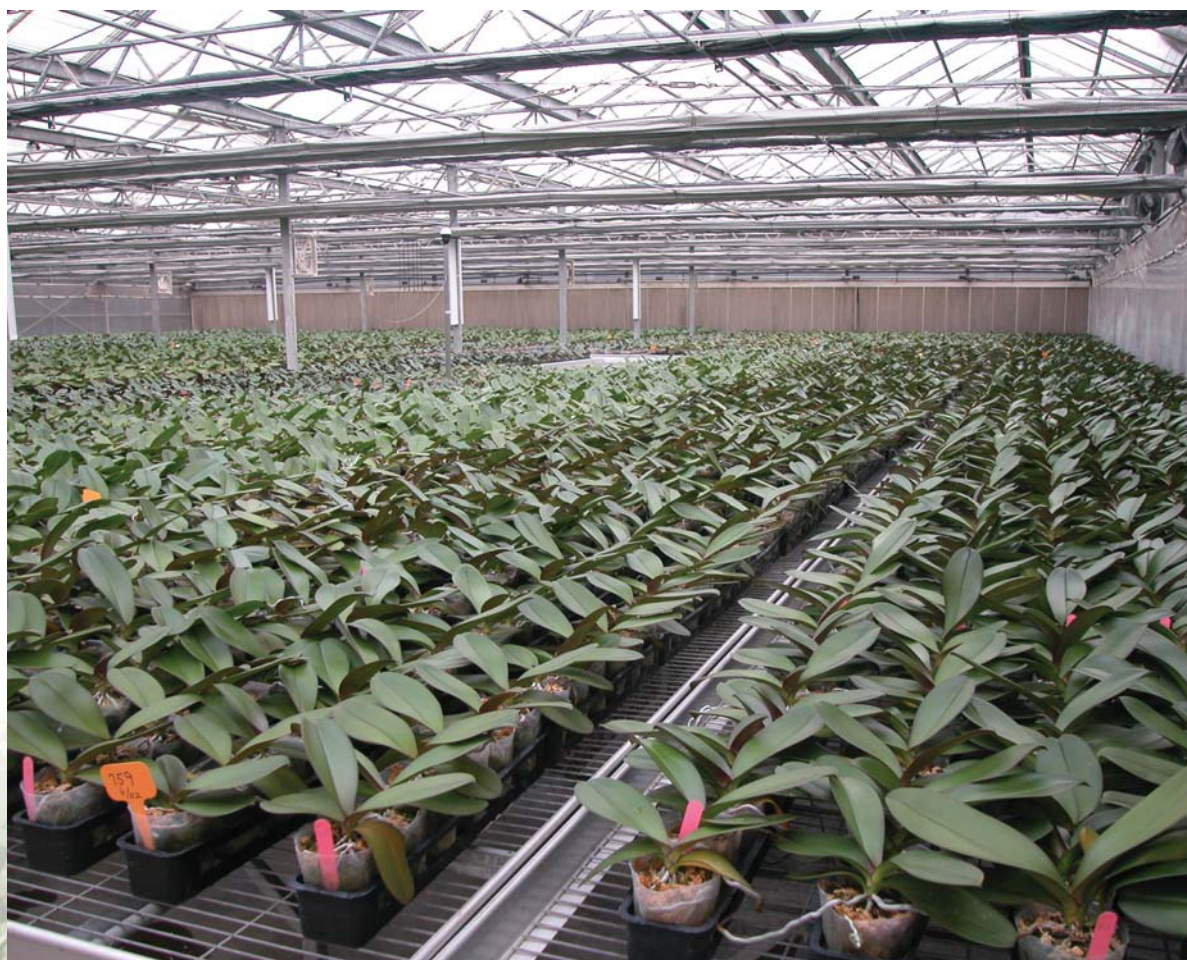
蝴蝶蘭組培苗生育整齊，一致性高。

植物組織培養技術的發展，造就了高產值的花卉產業，是維持目前國內生技種苗業的主要力量。臺灣花卉種原豐富，未來若能善用組織培養技術，開發出更多具有產業價值的新品種，掌握品種優勢，臺灣的花卉產業必能在國際市場上佔有一席之地。