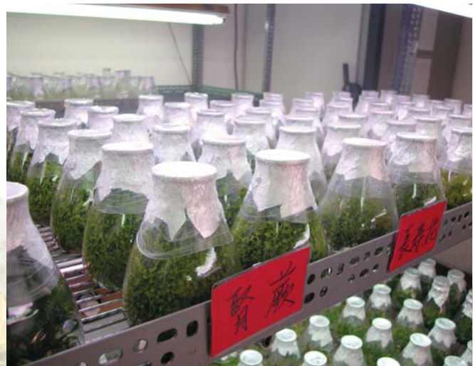
植物組織培養可在短期內量產花卉種苗。

花卉市場講究的是流行趨勢，新品種的開發比起其它作物更為殷切，育種工作也愈為重要，而組織培養技術可加速新品種的育成，更是蘭花育種的必備程序。傳統育種上的遠緣雜交，常有不親和現象，無法獲得雜交後代，此時可應用胚培養挽救。例如百合種間的不親和