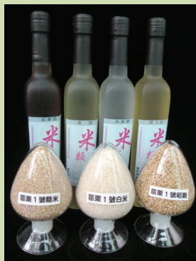
水稻苗栗1號稻穀、糙米、白米及其酒品