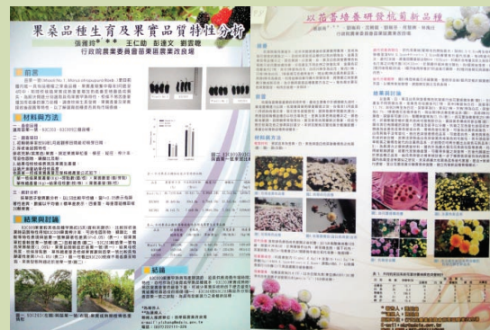
本次農藝學會本場海報展示成果