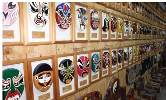
雙潭休閒農業區內各式各樣的臉譜