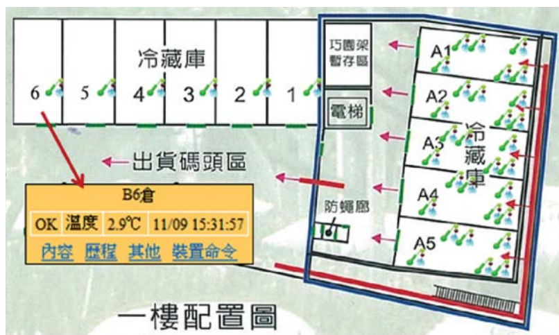
管理者在電腦中可立即查詢出各倉庫的即時溫度、歷史溫度及進行設定等作業

本案於傑農合作農場結合自動輸送 RFID 磅秤，以自動化滾軸式輸送設備自動擷取柑橘重量功能及進行洗浸作業，並導入環境監控系統，建立以溫度感測器為基礎的溫度感測及監控系統，共建置 10 間檢疫倉庫及 6 間非檢疫倉庫，達到全部冷藏倉庫皆可隨時監控，經評估自動化設備之導入每年可節省 73,689 元，環境監控系統之導入每年可節省 46,257 元，經濟效益相當顯著。本計畫並將開發之系統開放給農民，讓農民可隨時查詢到自己的貨品數