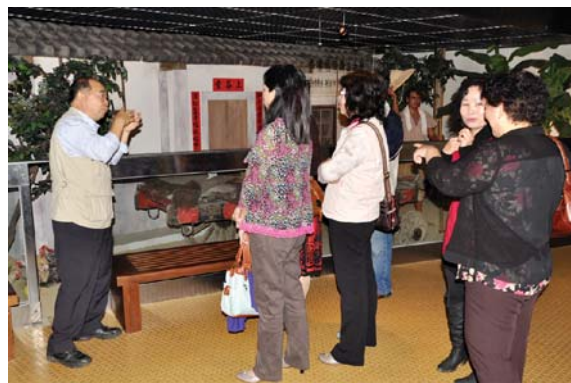
同仁為參觀民眾解說

除了園區予民眾參觀外並邀請轄區鄉鎮農會、產銷班、家政班、有機農場及農業相關協會等56個單位配合參與國產農特產展售。兩天活動共吸引7,816人次參觀，銷售金額約50餘萬元，成效良好。