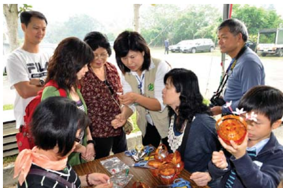
蠶繭花製作過程說明