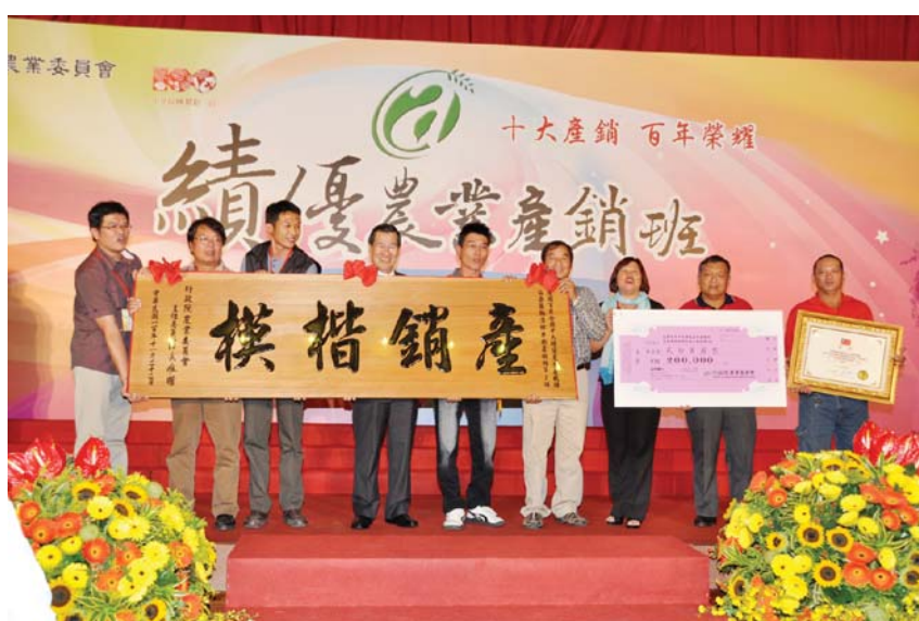
蕭副總統頒發當選證書、獎金及匾額予本縣獅潭鄉果樹產銷班第2班

師活動。轄區94年度獲選的卓蘭鎮楊桃產銷班第1班、95年度獲選的卓蘭鎮果樹產銷班第63班及98年度獲選的大湖鄉果樹產銷班第13班之班長及副班長等代表，也參與此會共同為灣農業加油打拼。