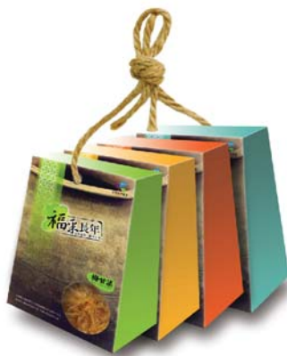
公館鄉農會蔬果加工伴手禮

為推廣地方產業特色，帶動在地消費，提昇農產品品質，開發精緻特色農產品，發展為地區之伴手產品。本年度協助轄區開發地方特色伴手產品有：公館鄉農會蔬果加工、後龍鎮農會雞精、大湖地區農會草莓活力穀粉等 3 項產品。