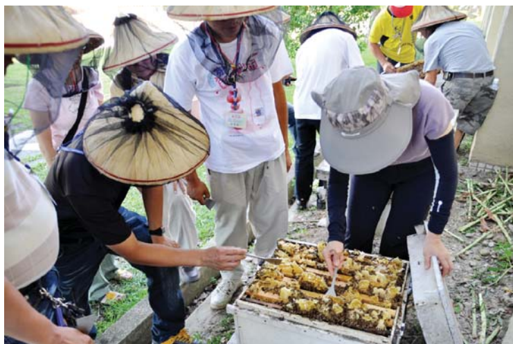
養蜂班學員於本場養蜂場觀摩蜂群管理之情形

(5日)」及「有機農場經營管理班(10日)」以有機農業生產技術之改進及品質提升為主軸，並導入經營策略、產品設計及行銷規劃等課題；進階訓練「生物防治班」將農業栽培常見之生物防治資材，如捕食性天敵、寄生性天敵、性費洛蒙及微生物等作深入淺出的介紹，並教導田間施放以防治病蟲害之操作方法。