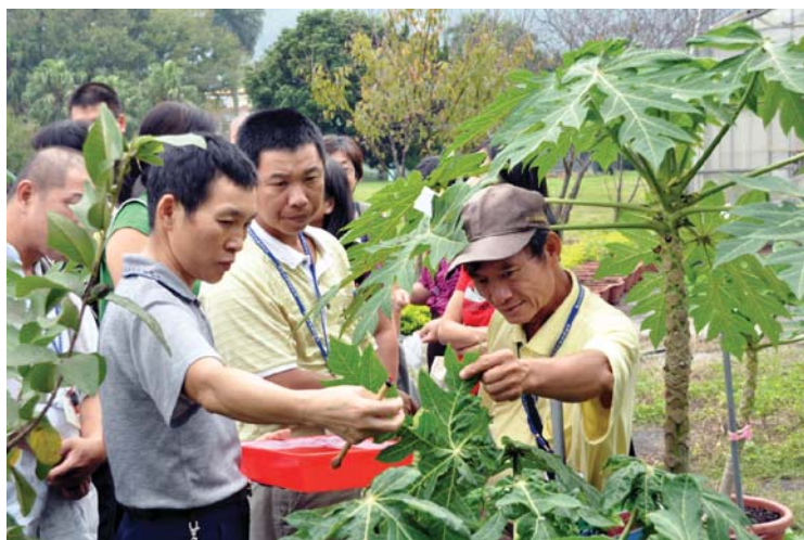
生物防治班學員於本場生物防治分場練習施放天敵之情形