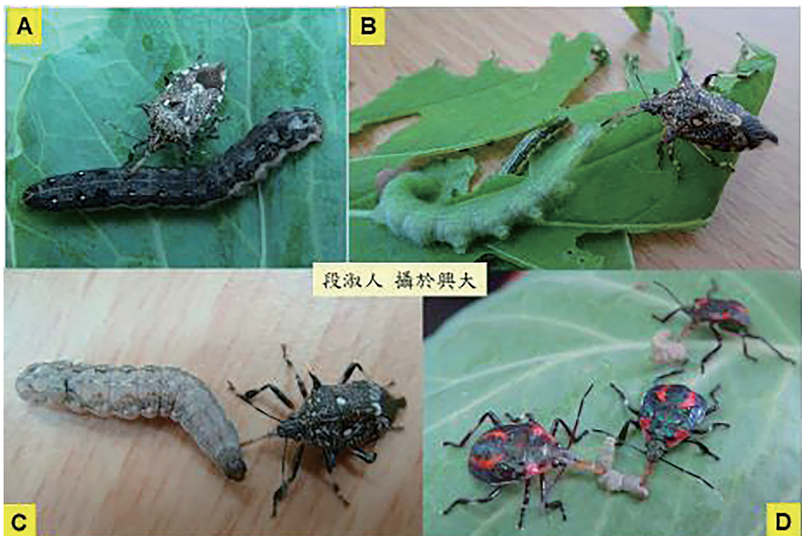
圖一、黃斑粗喙椿象成蟲捕食斜紋夜蛾 (A)、紋白蝶 (B)、甜菜夜蛾 (C) 之幼蟲，黃斑粗喙椿象若蟲搶食小菜蛾之幼蟲 (D)。

Tuan, S. J.*, Y. H. Lin, S. C. Peng, and W. H. Lai. 2016c. Predatory efficacy of Orius strigicollis (Hemiptera: Anthocoridae) against Tetranychus urticae (Acarina: Tetranychidae) on strawberry. Journal of Asia-Pacific Entomology 19(1): 109-114.