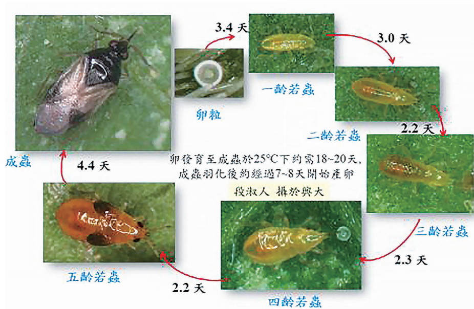
圖四、捕食二點葉蟬卵於 25°C 下，南方小黑花椿象之生活史。