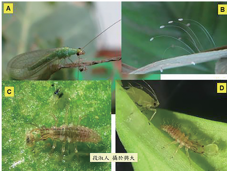
圖五、基徵草蛉成蟲 (A) 及卵粒 (B)，以及幼蟲取食二點葉蟬 (C) 與桃蚜 (D)。