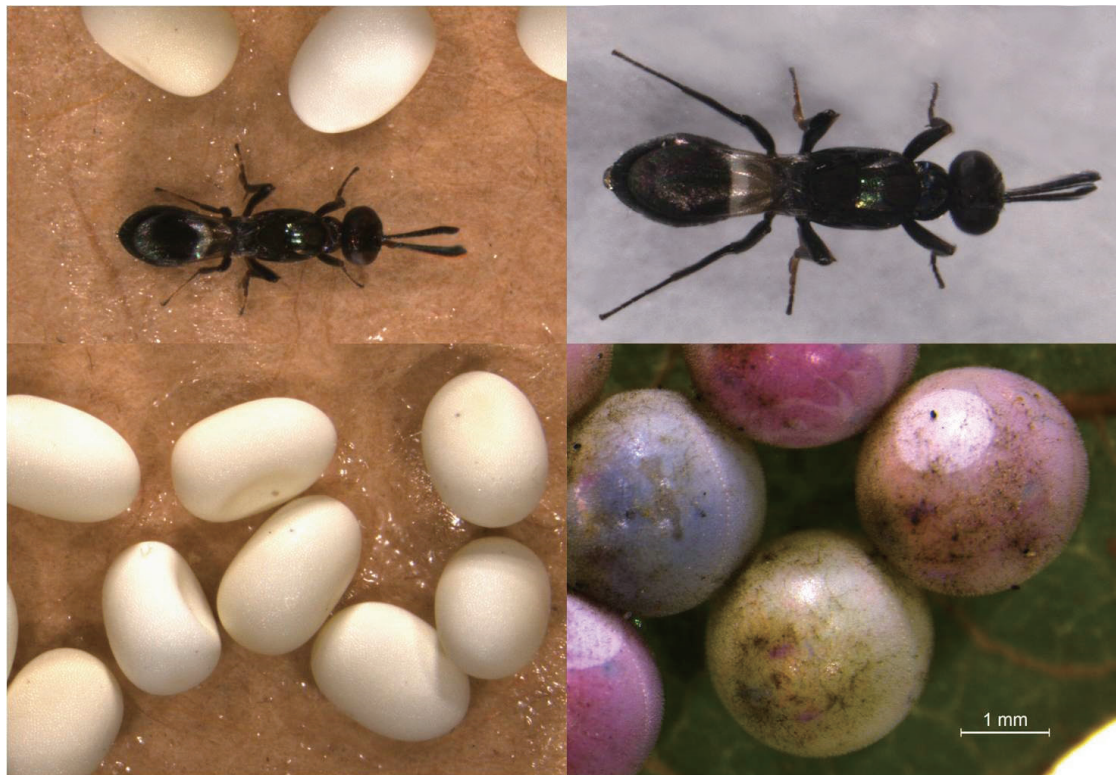
圖二、由不同寄主羽化出的平腹小蜂

Fig. 2. Anastatus fulloi emerge from different host eggs. (A) Laboratory-reared A. fulloi emerge from Samia cynthia (B) Egg of S. cynthia (C) Wild-caught A. fulloi emerge from Tessaratomia papillosa (D) Egg of T papillosa .