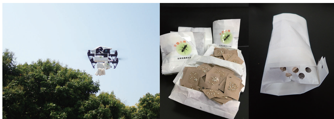
圖三、以無人機釋放平腹小蜂於荒廢園區

Fig. 2. Anastatus fulloi emerge from different host eggs. (A) Laboratory-reared A. fulloi emerge from Samia cynthia (B) Egg of S. cynthia (C) Wild-caught A. fulloi emerge from Tessaratomia papillosa (D) Egg of T papillosa .