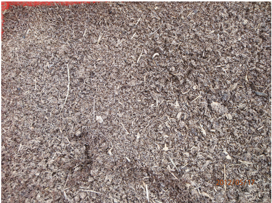
圖一、乳牛糞經黑水虻處理後的虻糞土壤改良資材。

Fig. 1. The dairy cow manure treated by black soldier fly as fly manure and soil improvement materials.