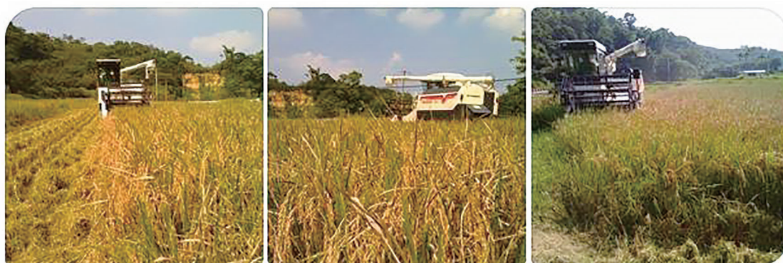
圖三、試驗組稻穗收穫情形。