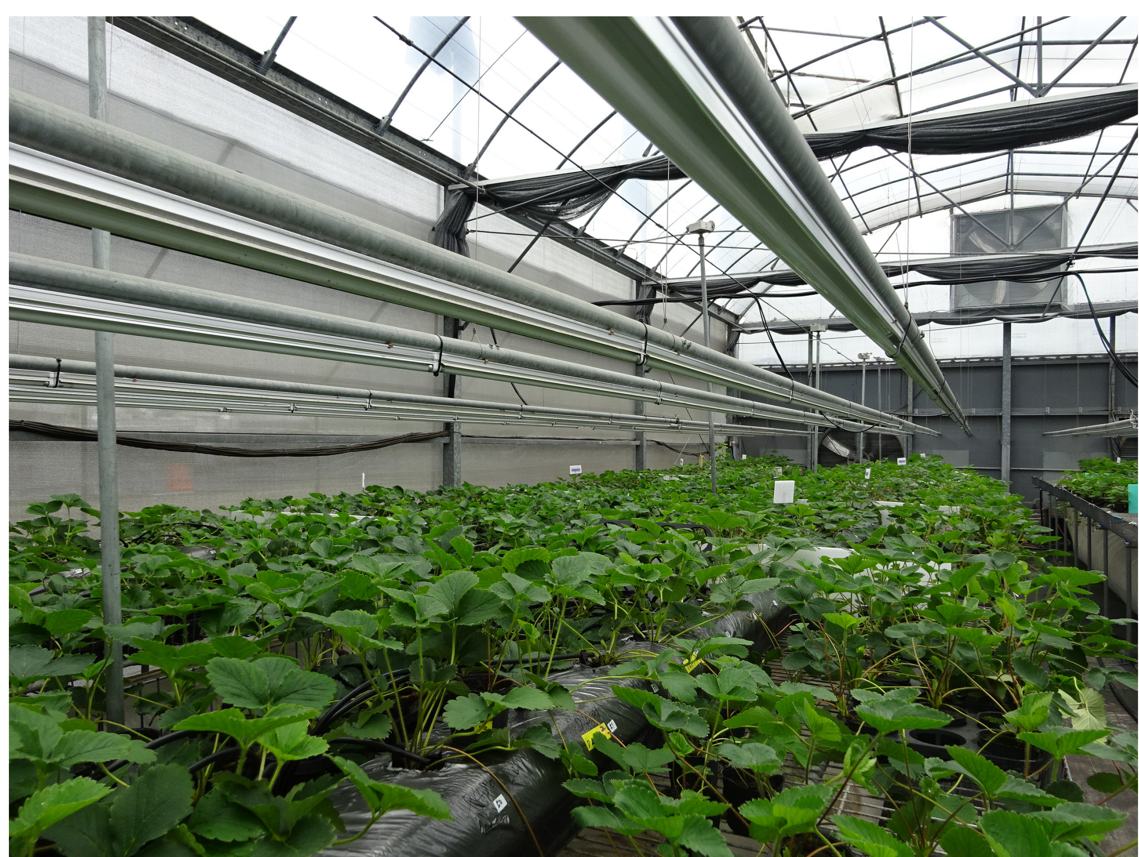
圖二、草莓種苗於隔離溫室內栽培實況（農業試驗所）