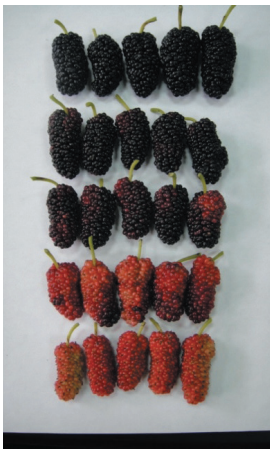
不同成熟度之桑椹果實（由上而下為完熟果、近完熟果、成熟果、半成熟果及未成熟果）

桑椹因皮薄多汁而容易受損且貯藏不易，因此包裝及貯藏保鮮處理格外重要。採摘完整無受損之果實，並使用小量的採摘容器，不僅有最佳的果實品質，且可避免再次整理及包裝造成果實損傷，且具有直接出貨銷售的優點。新鮮桑椹必須在採收後當天食用完畢，利用冷凍保存方式可延長賞味期限，冷凍前以清水將表面雜質去除，經分裝後置入 -20 °C 冷凍保存，取出後可立即食用，無需再次清洗。