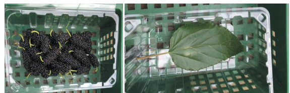
小包裝盒採收桑椹可避免擠壓且可直接出貨