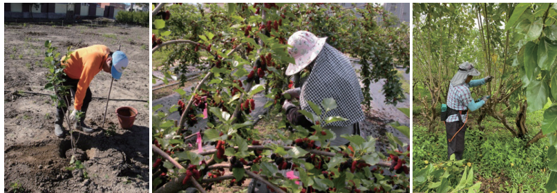
圖、桑椹栽培重點管理工作