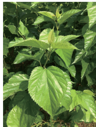
圖四、田間管理補充硼鈣肥及待氣溫回暖後，桑園回復正常幼葉樣態。