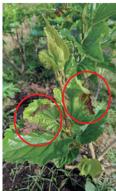
圖一、桑葉受霜害影響而呈現不規則焦枯症狀，受害範圍分布在同一時間點的嫩葉。

桑樹 ( Morus alba L.) 是桑科 (Moraceae) 多年生木本植物，為常綠樹種，冬季具有不落葉特性，桑葉一般常供藥用、養蠶等特作用途，近年來苗栗區農業改良場推廣以採摘幼葉加工製作 GABA 桑葉茶，春、夏及秋季皆為桑菁採摘適期。但在小寒至立春之節氣期間，若遇清晨發生結霜情形，需留意一心二葉採摘處的幼葉葉片是否出現明顯皺縮症狀，嚴重者有葉尖及葉緣焦枯情形，而老葉則症狀輕微，持續觀察葉焦枯症狀數天若無蔓延，即可斷定為霜害。前述出現之部分幼葉皺縮，與幼嫩莖部非正常之平滑樣態，此與一般作物典型缺硼症狀相似，加以觀察田間周邊闊葉草 (如咸豐草) 之雜草，亦可見類似症狀，但待清明時期氣溫回暖大多能自然回復正常，故可知此類缺硼症並非土壤養分欠缺造成，而是低溫環境減緩土壤養分吸收，及植株蒸散作用減緩，因此生長停滯僅是暫時性表徵。本研究建議善用一些田間管理技巧以減緩低溫霜害症狀：1. 幼嫩葉片不像成熟葉具有革質表皮能抗低溫，需避免冬季施氮肥以減緩隔年春芽因暖冬提早萌發。2. 避免冬季葉面施肥及噴灌造成土壤潮濕，如遇低溫致使葉緣產生泌液，乾燥後高量鹽分容易傷及葉緣組織。3. 以草生栽培取代塑膠布與雜草抑制蒨栽培，能增強根圈冬季保溫及水分控制之功效。4. 根系周圍澆灌硼鈣液肥，可增強植株組織韌性及強度。5. 分層採摘桑菁，避免同時間過多新葉長出彼此競爭體內硼素。經過以上五項管理措施後，桑園均可自然回復原有正常生長樣態。