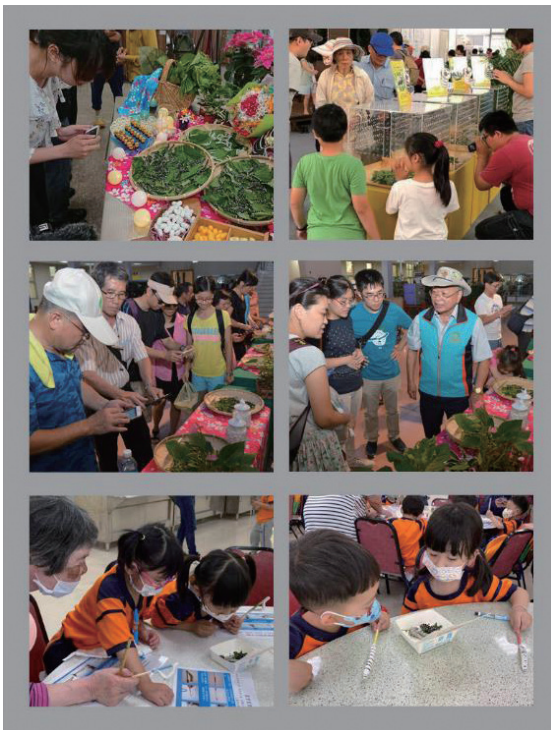
圖一、斑紋蠶之推廣推廣情形

本場自家蠶種原庫中以斑紋形態家蠶及具強健特性姬蠶育成 4 個斑紋蠶推廣品系(種)。自 107 年推出「臺蠶 8 號 - 黑旋風」後，陸續再推出「臺蠶 9 號 - 黑精靈」、「臺蠶 10 號 - 雲點點」及「臺蠶 11 號 - 虎寶」。每年生產各品系(種)斑紋蠶卵達 84 蛾圈以上，約 42,000 粒蠶卵提供給民眾飼養。斑紋蠶甫推出時年供應 40,000 粒蠶卵最盛，近年平均年供應 18,000 粒蠶卵，其中以臺蠶 8 號 - 黑旋風最受到喜愛，其次為臺蠶 11 號 - 虎寶。蠶農販售斑紋蠶平均價格為每隻幼蟲 5 元，較單隻姬蠶幼蟲收益提高 1.5 倍，活絡飼養家蠶周邊產品銷售，經濟效益明顯提升。本場將持續選育產業所需之家蠶品系(種)，提供活體家蠶商品市場更多元化的選擇。