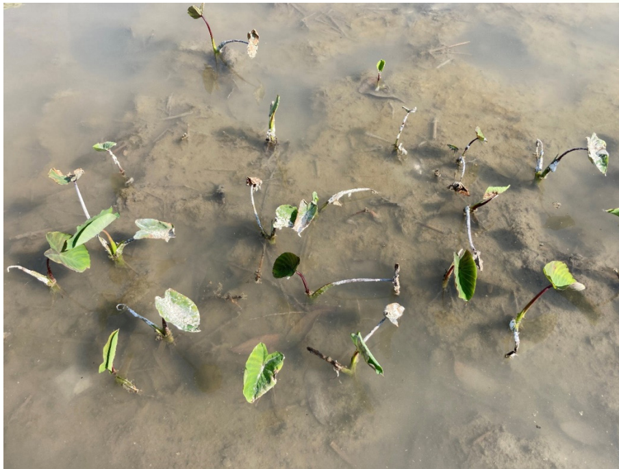
▲ 1 月 26 日苑裡鎮會勘芋頭植株上不明白色粉末狀物質汙染案