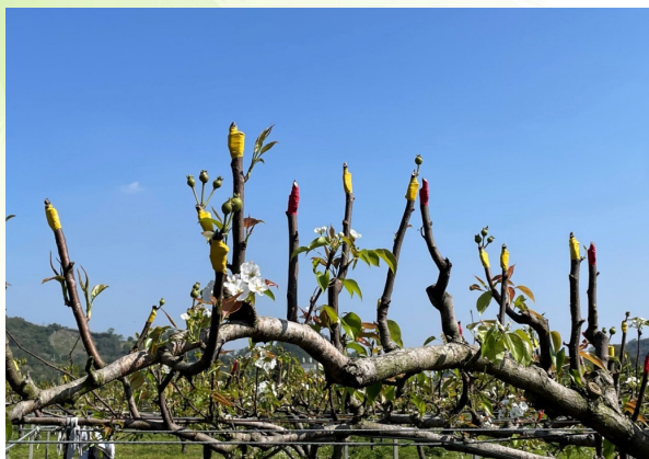
▲ 110年1月上旬寒流高接梨穗遲發性受災情形