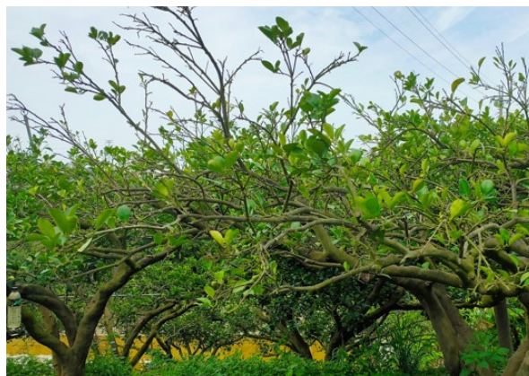
▲ 110年3~5月高溫乾旱文旦落葉落果，結果比率偏低