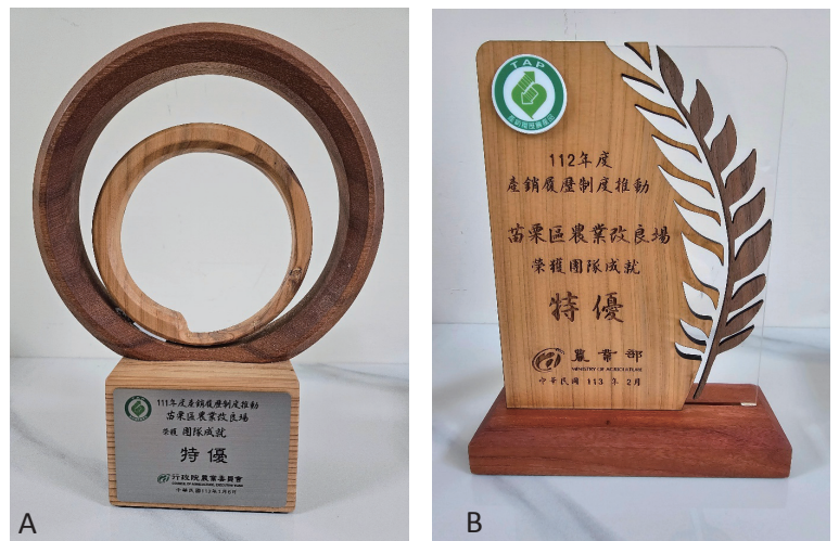
圖二、A. 本場榮獲 111 年度產銷履歷推動~團隊特優獎。 B. 本場榮獲 112 年度產銷履歷制度推動~團隊特優獎。